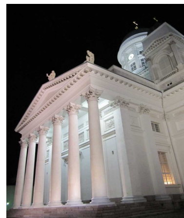
Klasicistní Dóm na Senátním náměstí v Helsinkách

Po přesunu z letiště Vantaa k hlavnímu železničnímu nádraží jsme měli možnost prohlédnout si centrum hlavního půlmilionového města Finska, Helsinek.