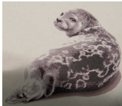
Tuleň kroužkový saimenský (Phoca hispida saimensis)

Na vedlejší ostrově, hned u hradu, je oblastní savonlinnské muzeum, ve kterém jsme si mimo ukázek ze života lidí na jezerech prohlédli i fotografie sladkovodních tuleňů, jichž zbývá už jen asi 300 kusů a jsou na pokraji vyhynutí, anebo např. snímky veřejné rychlobruslařské dráhy, 30 km dlouhé, kterou každou zimu upravují na jezeře Saimaa.