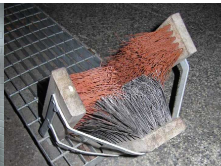
Kartáče na čištění bot